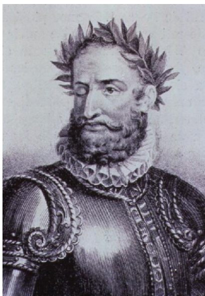
Luís de Camões